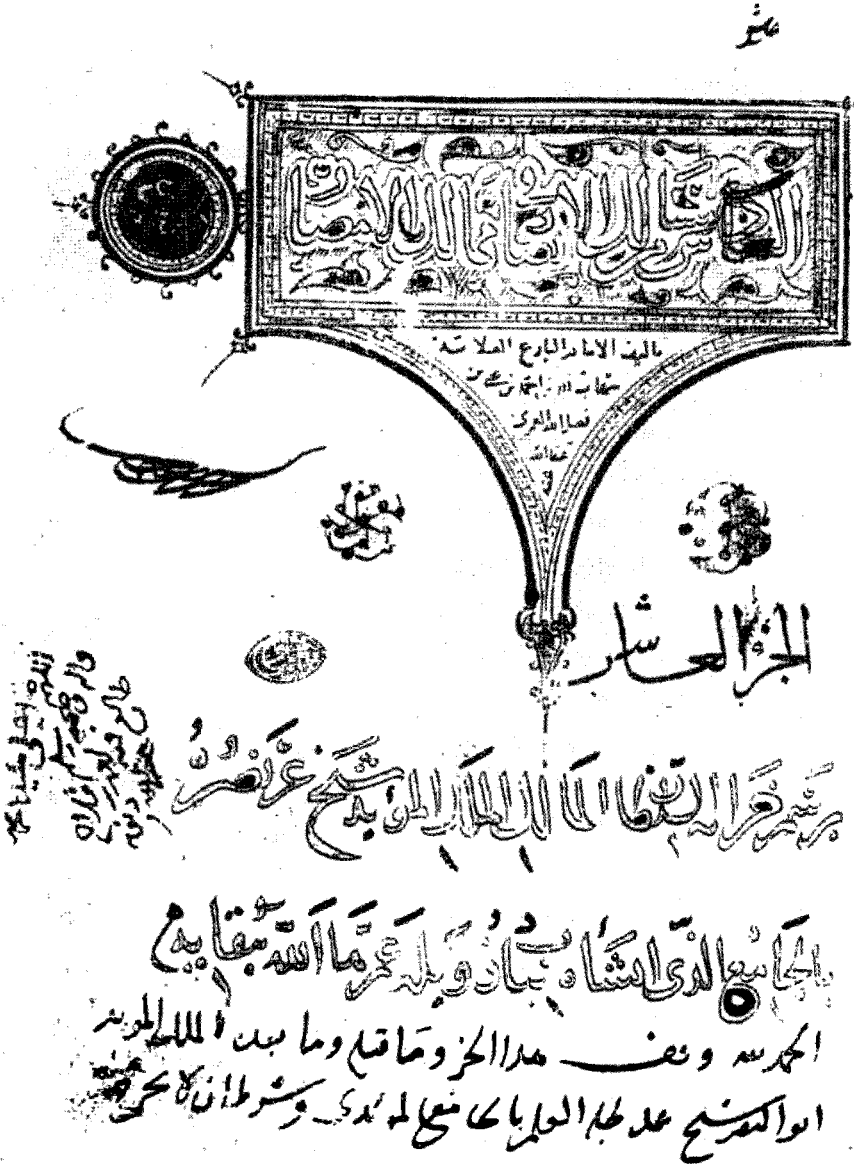
صفحة العنوان - مخطوطة أبا صوفيا - مكتبة السليمانية - استانبول، رقم ٣٤٢٣